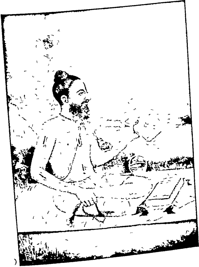
गोस्वामी तुलसीदासजी महाराज